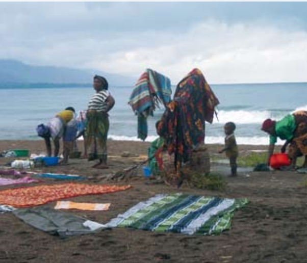
Angehörige der Patienten waschen im Nyassa-See ihre Wäsche und legen sie zum Trocknen am Strand aus.

Die Kirche ist brechend voll, und alle Wazungus sitzen in der zweiten Reihe und werden wie immer begafft. Die zahlreichen Chöre überwältigen mich: So viel Kraft, Freude und Bewegung habe ich noch nie erlebt. Vor allem der Kinderchor mit den beiden kleinen Trommlern und der zwölfjährigen Dirigentin ist fantastisch. Die Stimmen und der Rhythmus sind einfach unbeschreiblich, und so ist es nicht verwunderlich, dass nach jedem Lied viel applaudiert wird. Zwischen den Gesängen, den Bekanntmachungen und der Predigt gibt es drei Kollekten. Während des Singens tanzen die Menschen nach vorn und spenden Geld oder Essen. Das Essen wird hinterher versteigert, und so habe ich für umgerechnet nicht mal 10 Cent meinen ersten Riesengranatapfel bekommen. Als wir Weißen uns der Gemeinde auf Kisuheli vorstellen, gibt es viel Gelächter, da die ersten Sprachversuche ziemlich unterhaltsam klingen müssen. Mit unserem Begrüßungslied „Hevenu Shalom“ ernten wir viel Applaus.