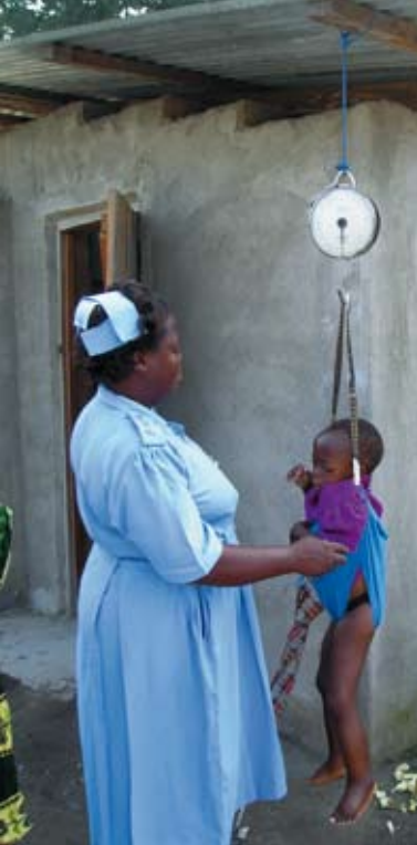
Wiegen gehört zum Alltag auf der Kinderstation im Matema-Krankenhaus.