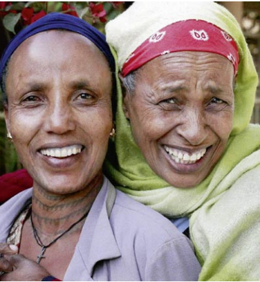
Eine Hoffnung unserer Partner in Äthiopien: Eine friedliche Gesellschaft, in der die Menschenrechte geachtet werden.

Seit den Tagen der ersten Christenheit halten die Christen über die Grenzen des eigenen Ortes und des eigenen Landes hinweg untereinander Kontakt: Damals waren es Jerusalem, Kleinasien, Griechenland, Rom/Italien, Nordafrika. Das hat sich über alle Jahrhunderte immer weiter entwickelt. Unsere Trägerkirchen und ihre Gemeinden, Einrichtungen und Werke haben gewachsene partnerschaftliche Beziehungen in viele Länder und Regionen: Südliches Afrika, Sambia, Tansania, Horn von Afrika, Israel/Palästina, Ostasien, Indien, Nepal, Russland/Wolgaregion, Baltikum, Polen, Slowakei, Tschechien, Großbritannien, Niederlande, Frankreich, Schweden, Finnland, USA, Brasilien.