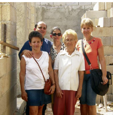
Die Kirchen in Kuba wachsen und vielerorts werden mit viel Organisationstalent Kirchengebäude gebaut oder saniert. Oben: Älteste in Jagüey auf ihrer Kirchenbaustelle. Unten: Kirche in Meneses

Die staatstragende Ideologie hinter diesem sozial-politischen System ist der Marxismus-Leninismus, wie er in der Sowjetunion und osteuropäischen Staaten praktiziert wurde, mit denen Kuba wirtschaftlich zusammen arbeitete. Die Einführung der atheistischen Weltanschauung beeinträchtigte das Verhältnis zwischen Kirchen und Staat sehr. Die christliche Erziehung in den Schulen wurde komplett eingestellt. Die bis zur Revolution von den Kirchen geleiteten allgemeinbildenden Schulen wurden an den Staat übergeben. Das führte zu einer sozialen Marginalisierung der Kirchen. Viele Jahre lang blieben die Kirchen fast leer, obwohl keine Kirche in Folge dieser Politik geschlossen wurde. Viele Pfarrer, Pfarrerinnen und Laien verließen das Land, viele Christen wandten sich von ihrer Kirche ab und der Revolution zu. Andere zogen sich aus der Gesellschaft zurück und hörten auf, öffentlich ihren Glauben zu praktizieren. Sie fürchteten mit ihrem kirchlichen Engagement Schwierigkeiten im alltäglichen Leben.