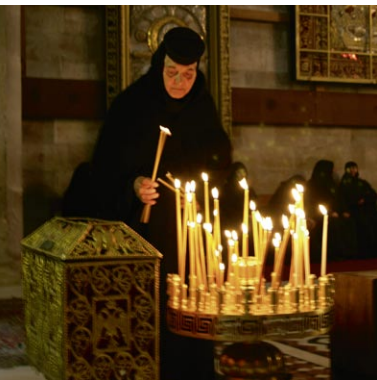
Oben: Kuppel der Grabeskirche

lebten und schließlich in der heutigen Zeit in den verschiedenen arabischen Ländern. Zu jeder Zeit wurden die Christen durch die jeweils herrschende politische Macht instrumentalisiert. Wo dies geschah, wirkte es sich als Desaster aus – so in den 1920er Jahren im Irak, im Libanon während des schrecklichen Bürgerkrieges zwischen 1975 und 1989.