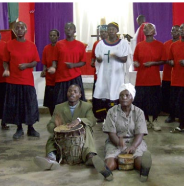
Oben und unten: Gottesdienst in der Süd-West-Diözese der Evangelisch-Lutherischen Kirche in Tansania

zum Christentum bekehren zu dürfen. Sie waren nicht begeistert, aber immerhin gestanden sie es mir zu. So nahm ich Taufunterricht und wurde noch im gleichen Jahr, 1984, getauft. Damit war ich der erste Christ in meiner Familie. Meine Taufe führte etwas später dazu, dass sich auch meine Geschwister taufen ließen. Aber meine Eltern blieben noch viele Jahre lang in ihrer Tradition.