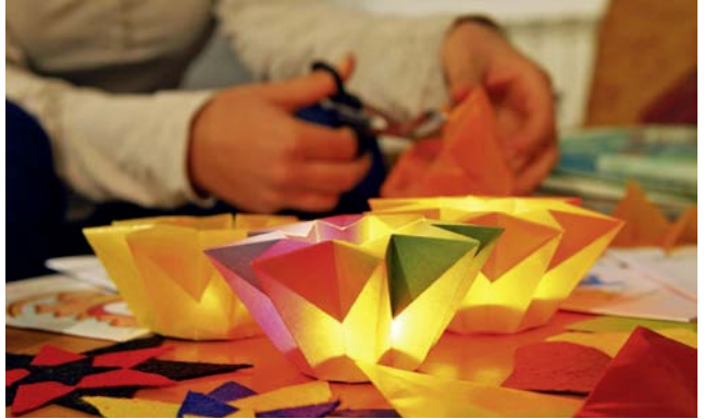
Weihnachtsbasteln in Talitha Kumi.

Und heute? Eine gewaltige Mauer durchschneidet das Heilige Land. Sie trennt Familien und lässt Wege zu Sackgassen werden. Sie teilt die Felder und Olivenhaine und macht Brunnen unerreichbar. Ein Drittel der Menschen in Bethlehem hat keine Arbeit, die Lebenshaltungskosten wachsen rasant. Die Menschen fühlen sich hilflos; viele sind verzweifelt.