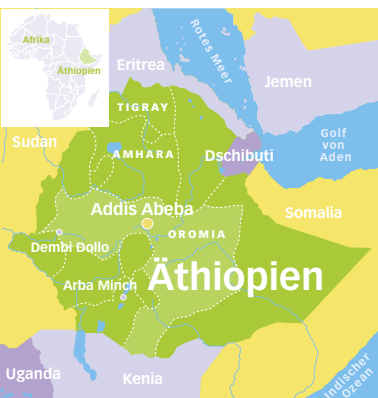
Das Bundesland Oromia (hellgrün) liegt zwischen dem eher orthodox geprägten Nordwesten, dem eher evangelisch geprägten Südwesten und dem eher muslimisch geprägten Osten Äthiopiens.

Dieser Masterplan trieb, wie zu erwarten, die Bevölkerung Oromias auf die Straße. Resultat eines einzigen Wochenendes in der Stadt Ambo: 74 Tote, dazu Hunderte Verletzte und Inhaftierte. Daraufhin verschwand der Masterplan zunächst wieder aus der Öffentlichkeit. Doch nach den Wahlen 2015 wurde er in unveränderter Form hervorgeholt. Seitdem ist das Land nicht mehr zur Ruhe gekommen: Demonstrationen, Generalstreik, Straßen-