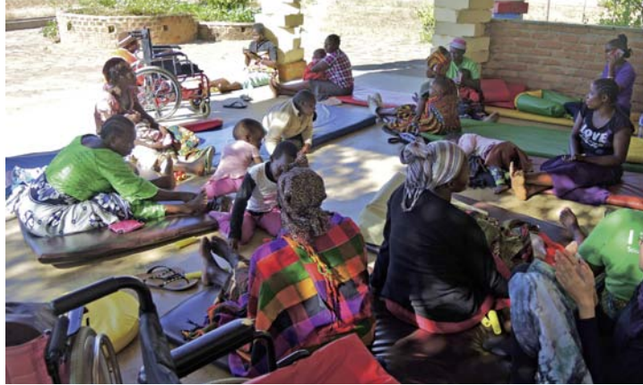
Abschlussrunde des Tages.

den verschiedene tansanische Lieder angestimmt, meist begleitet durch Klatschen und Trommeln. Der Abschluss des Tages ist wie ein kleines Ritual: Dreimal klatschen für die Lehrer und Therapeuten, dreimal Finger schnalzen für die Eltern, dreimal stampfen für die Kinder und danach fallen sich alle in die Arme und rufen laut „woow“.