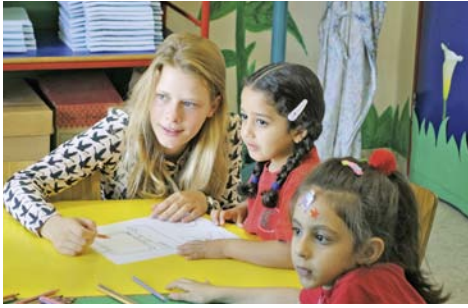
Talitha Kumi: Vorfreude, Mut, Kakao .... 14