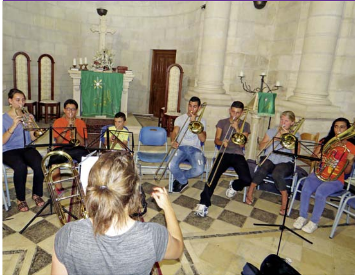
Probe mit Jungbläsern in der Weihnachtskirche Bethlehem, August 2016.