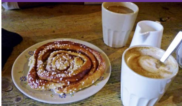
Fikapaus, die schwedische Kaffeepause.

runter-, vor-, zurücktrug. Und nach Konzerten musste wieder Ordnung hergestellt werden. Auch habe ich dem Organisten geholfen: Noten umblättern.