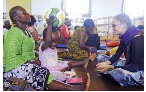
Tansania: Positive Energie..... 20