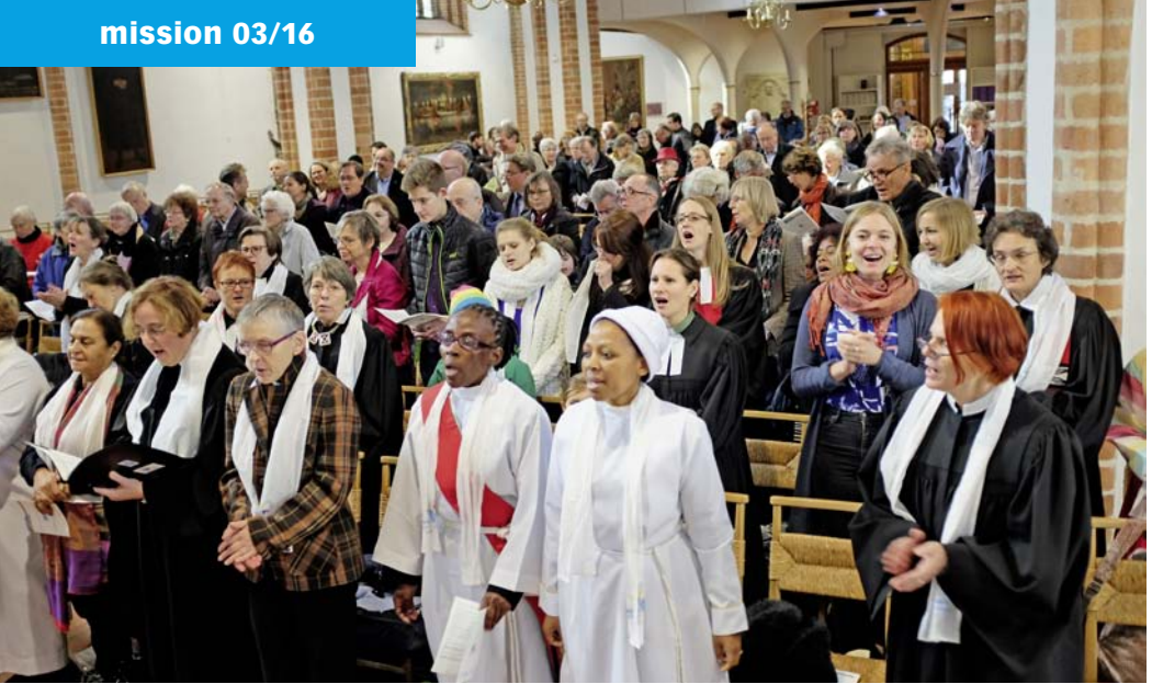
Abschlussgottesdienst in der Spandauer Nikolaikirche, Wiege der Reformation in Brandenburg.

Kirchen“. „Es sind die Frauen, die in den Kirchen die meiste ehrenamtliche Arbeit machen, aber die wichtigsten Funktionen nicht erreichen“, resümiert Windsor. „Sie sind es, die sich in unterschiedlichen Situationen ausgenutzt und wehrlos fühlen – ob in Indien oder Tansania, den USA oder Deutschland. Das Gefühl kann hier jede Frau nachvollziehen.“